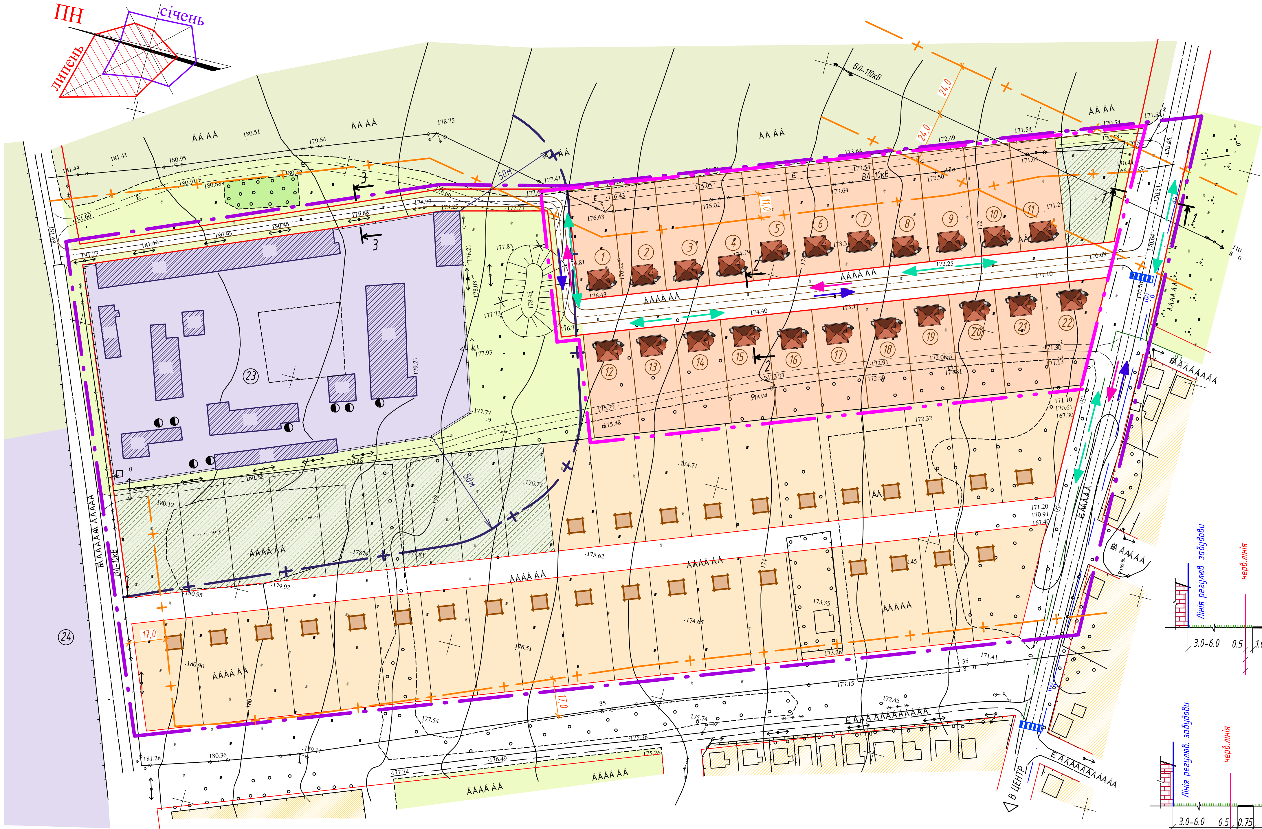
Експлікація будівель і споруд